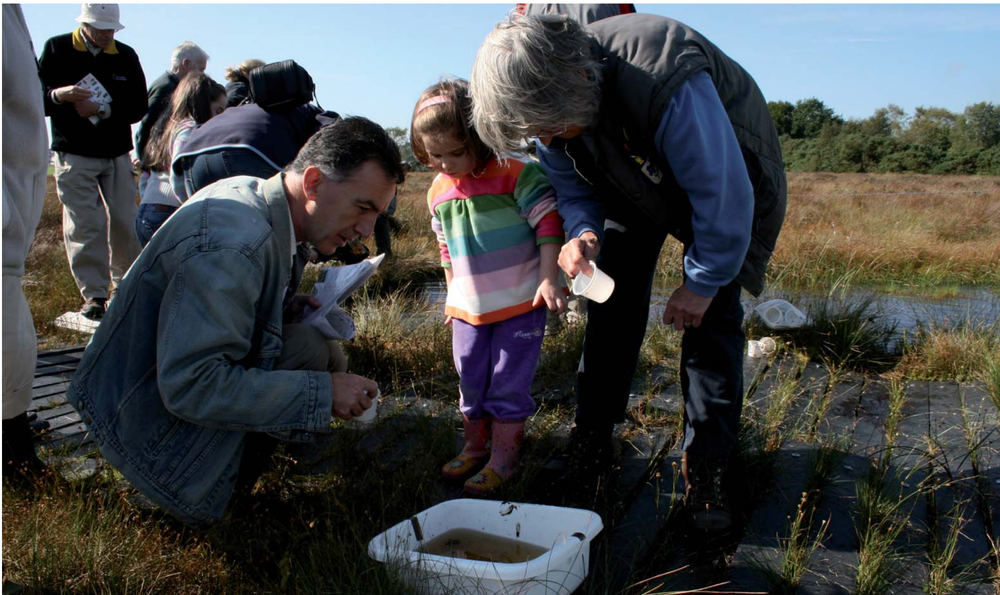
CUAIRT AR LÁITHREÁN I LOILÍOCH MÓR