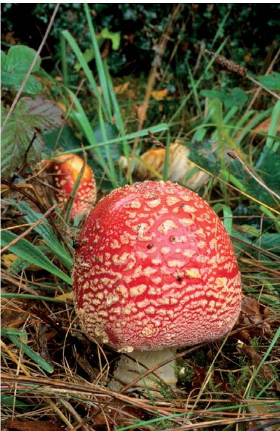
BARR: TURSARRAING MHÓR THUAS: CAIDHP CHÉARACH

clúdach ainmhithe agus éan le bogadh tríd an tírdhréach, chomh maith le soláthar maith de bhia a chur ar fáil. Cuireann crainn fáil go mór le héagsúlacht struchtúr fála agus cuireann siad áiteanna breithe ar fáil d'ialtóga agus áiteanna peirse d'éin. Leis na fála clúdaithe ar an tírdhréach cheapfaí go mbeadh sé níos coilltí ná atá sé.