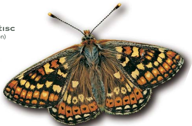
FRITILEÁN RÉISC

Maireann roinnt plandaí agus ainmhithe annamha, cosanta agus bagartha i gCill Dara. Is plandaí cosanta iad na cinn atá cosanta go reachtúil faoin Ordú um Chosaint Flóra faoin Acht um Fhiadhúlra (Leasú) 2000 (mar shampla Duileasc Abhann, basal, tím, nó Beathnua Gaelach). Tugann cosaint do roinnt ainmhithe faoi na hAchtanna um Fhiadhúlra (mar shampla gach mamach dúchasach). Bíonn na speicis atá liostaithe in larscríbhinn II sa Treoir maidir le Gnáthóga ó Aontas na hEorpa (mar shampla Dóbharchúnna, Gliomach Fionnuisce Báningneach, Fritileán Réisc) nó larscríbhinn I ó Threoir maidir le hÉin (mar shampla An Fheadóg Bhuí, An Chruidín) faoi chosaint chomh maith. Tá tuilleadh eolais faoi reachtaíocht um Fhiadhúlra Náisiúnta agus an Aontas Eorpaigh ar fáil sa Rannóg faoin teideal 'Polasaithe agus Reachtaíocht'.