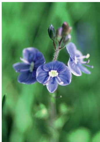
THUAS: ANUALLACH (© Zoë Devlin) AR DHEIS: HERITAGE BUTTERFLY NEWBRIDGE (© Déagán dePaor)