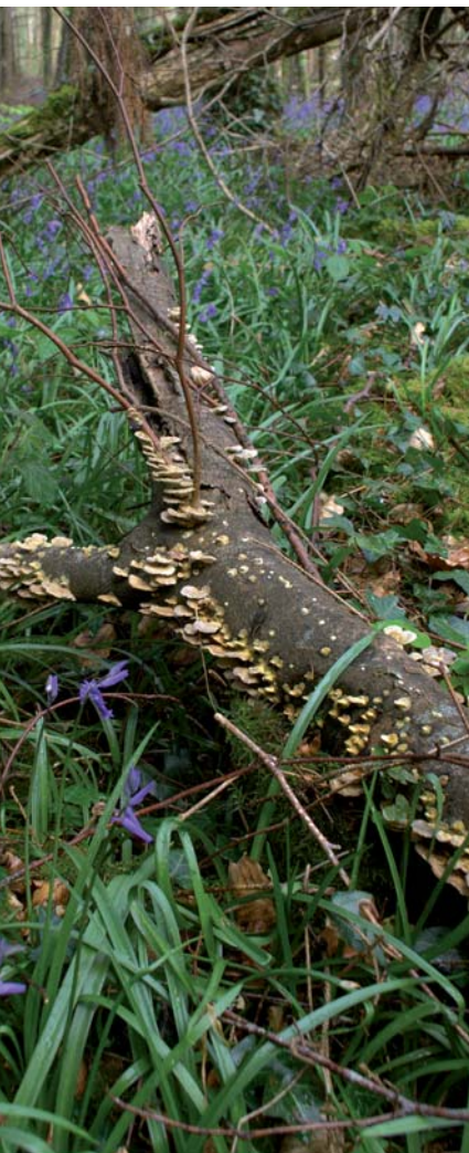
FUNGAS AR CHRAOBH

acmhainn oideachasúil. Tá Bord na Móna ar leis cuid mhór de phortaigh Chill Dara, i ndiaidh limistéar áirithe portach a bhfuil luach ard caomhantais orthu a aithint, limistéir de lagphortaigh atá i ndiaidh athchoiliniú go nádúrtha agus tá ardleibhéal bithéagsúlachta á fhorbairt acu. Tá luach ar leith ag na lagphortaigh don fhiadhúlra agus do chaomhnú an dúlra. Tá seans maith acu a bheith ina gcomarclanna nádúrtha má dhéantar bainistíocht cheart orthu.