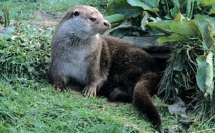
MADRAÍ UISCE