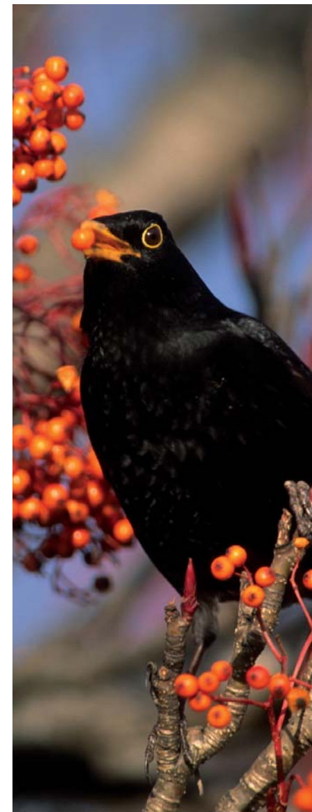
LON DUBH

Gabhaim buíochas le gach duine a d'oibrigh ar son an phlean agus go n-éirí le gach duine a d'oibrigh air.