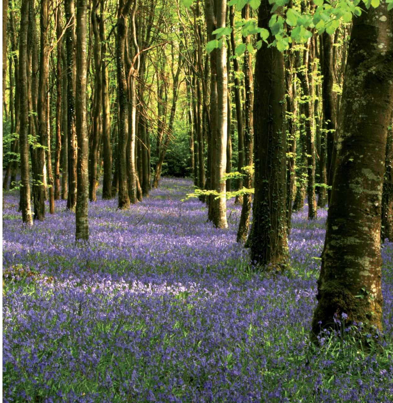
COINNLE CORRA

Fuair Suirbhé Fhál Sceach Chill Dara, a rinneadh i 2006, amach go bhfuil acmhainn shuibhir a fháil ag Cill Dara, rud a dhéanann an contae níos tarraingte. Is iomaí buntáiste a bhaineann le fála sceach don talmhaíocht, do thírdhreacha, do cháilíocht timpeallachta agus don fhiadhúlra ach go háirithe. Mar ghnéithe líneacha ar an tírdhréach, bíonn fála ina hallaí fiadhúlra, ag