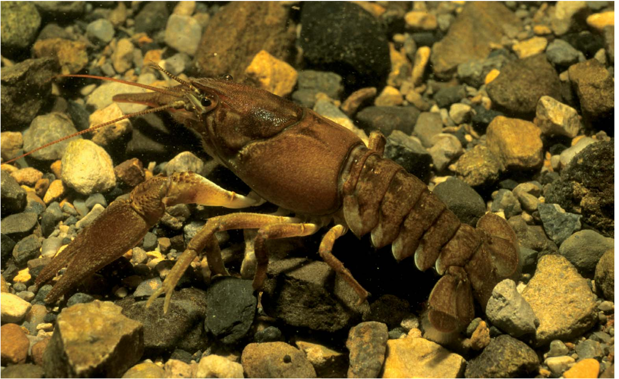
GLIOMACH FIONNUISCE